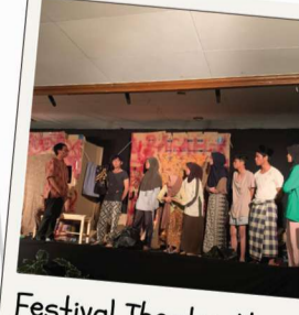
Festival Theater Muse