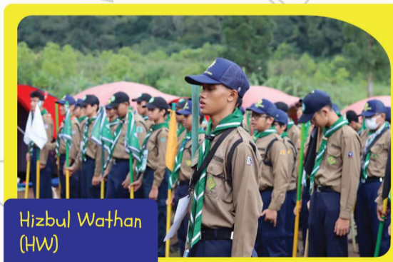
Hizbul Wathan (HW)