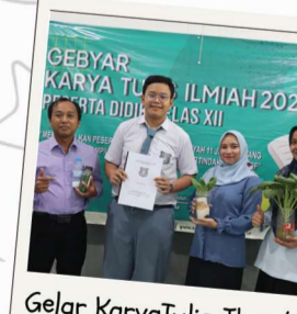
Gelar Karya Tulis Ilmiah