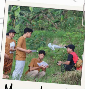
Muse Live In